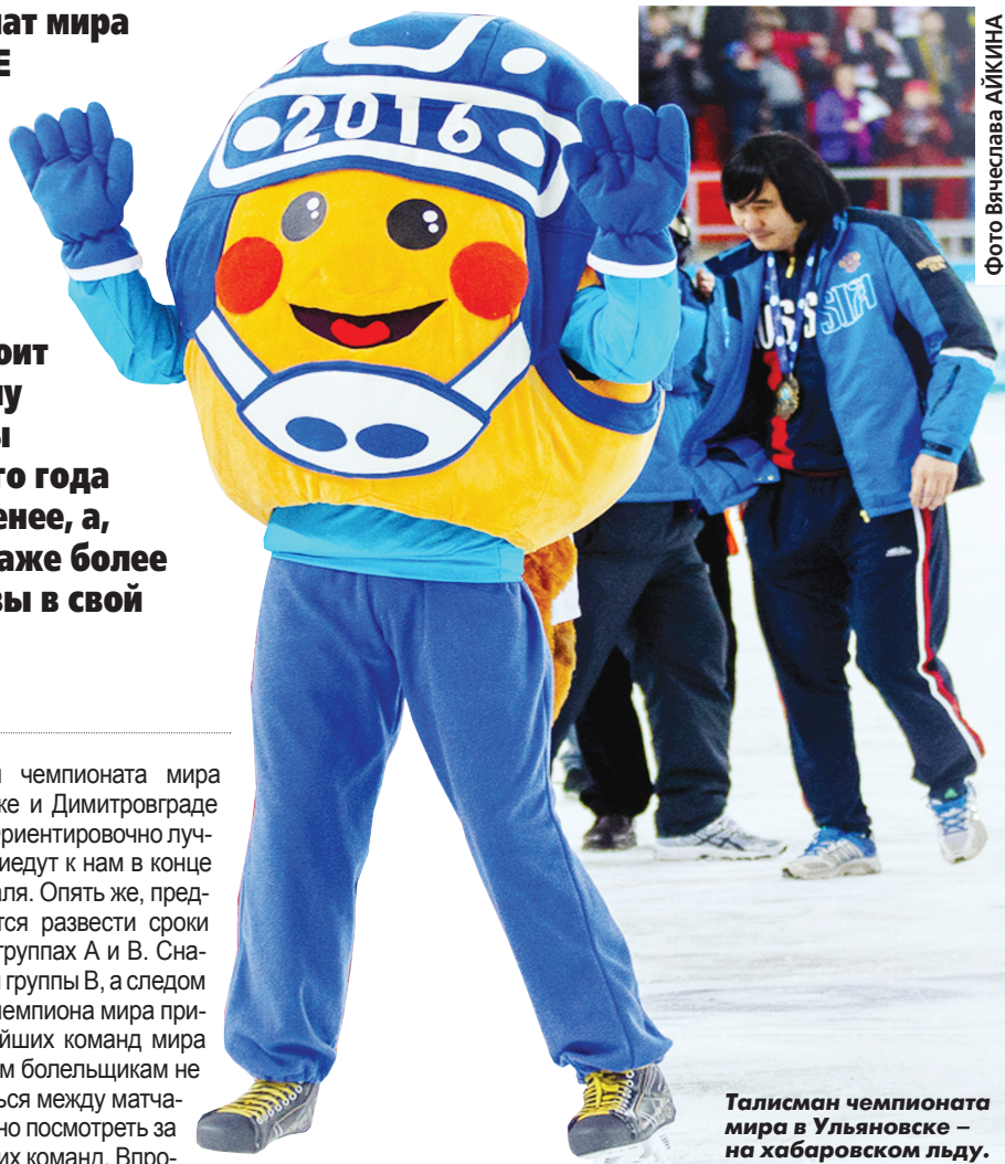
Талисман чемпионата мира в Ульяновске - на хабаровском льду.

На чемпионате мира в Хабаровске рядом с ареной «Ерофей» работала парковка на 1600-1800 автомо-