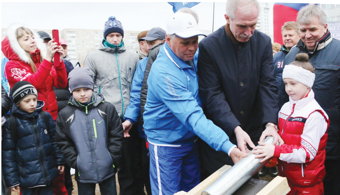
Капсулу с посланием будущим поколениям закладывали всем миром: чиновники, руководители «Ориона», ветераны спорта и, конечно, юные спортсмены, для которых и построят новый ФОК.

В Заволжском районе Ульяновска заложили первый камень в строительство ФОКа «Орион». Этот комплекс, как заверяют авторы проекта, станет центром развития физкультурного движения и школьного спорта.